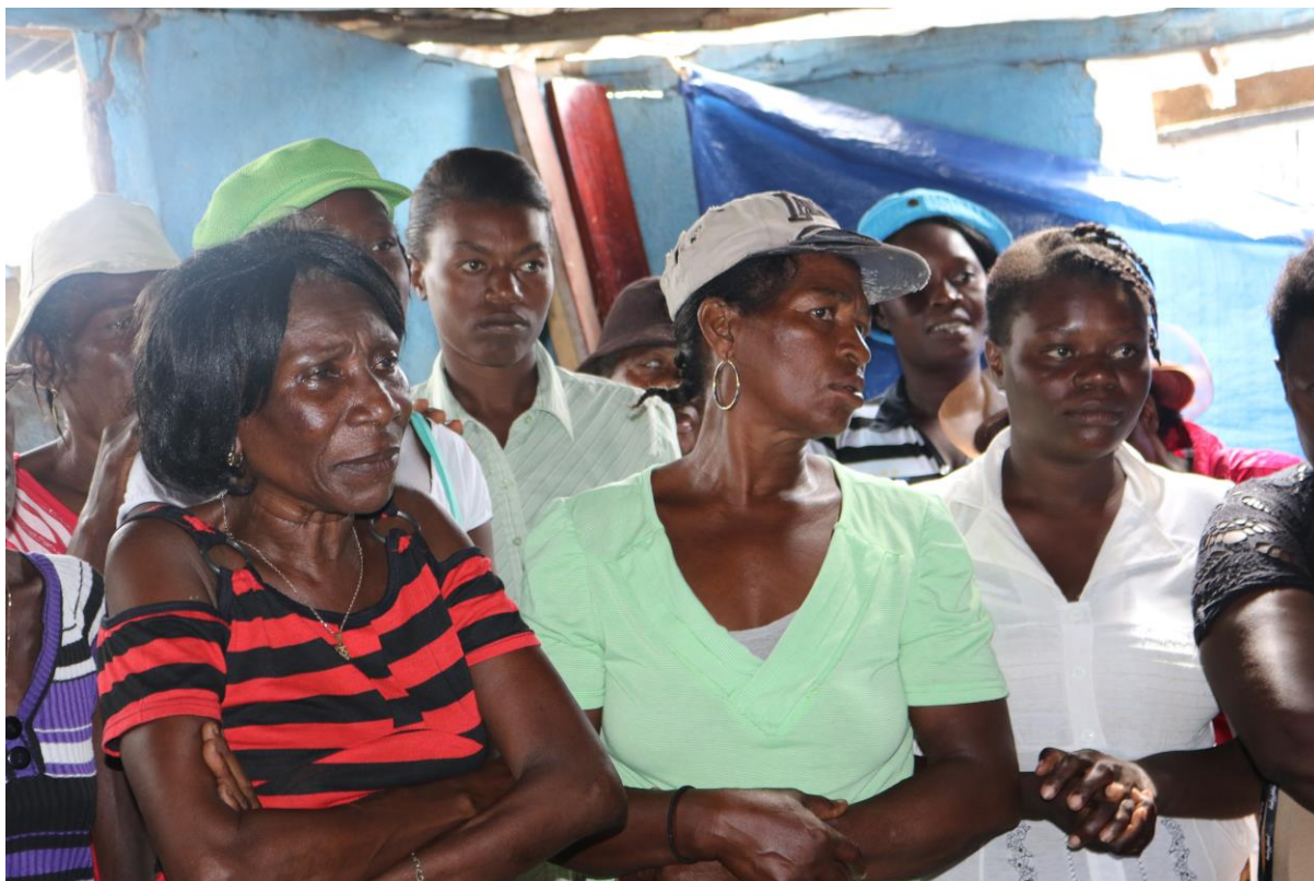
Première rencontre du sous-groupe VBG de Jérémie